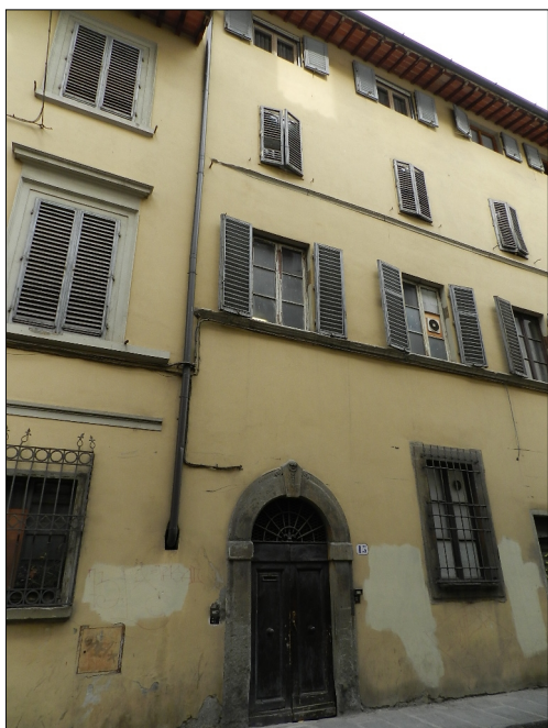
Sede storica della Società Via della Pergola n.9 Firenze

Nel 1861, con l'unità di Italia, l'associazionismo mutualistico divenne un punto di fondamentale importanza, per le classi dirigenti liberali, sia come strumento per una presenza sul terreno delle politiche sociali, in assenza di interventi diretti dello Stato; sia come affermazione di un principio laico, di regolazione del delicato terreno dell'assistenza e della previdenza, che era stato fino allora appannaggio soprattutto delle corporazioni di mestiere e delle istituzioni legate alla Chiesa. Del resto anche nella realtà odierna il mondo dell'associazionismo, accanto a quello delle istituzioni preposte, assolve un ruolo molto importante a livello sociale.